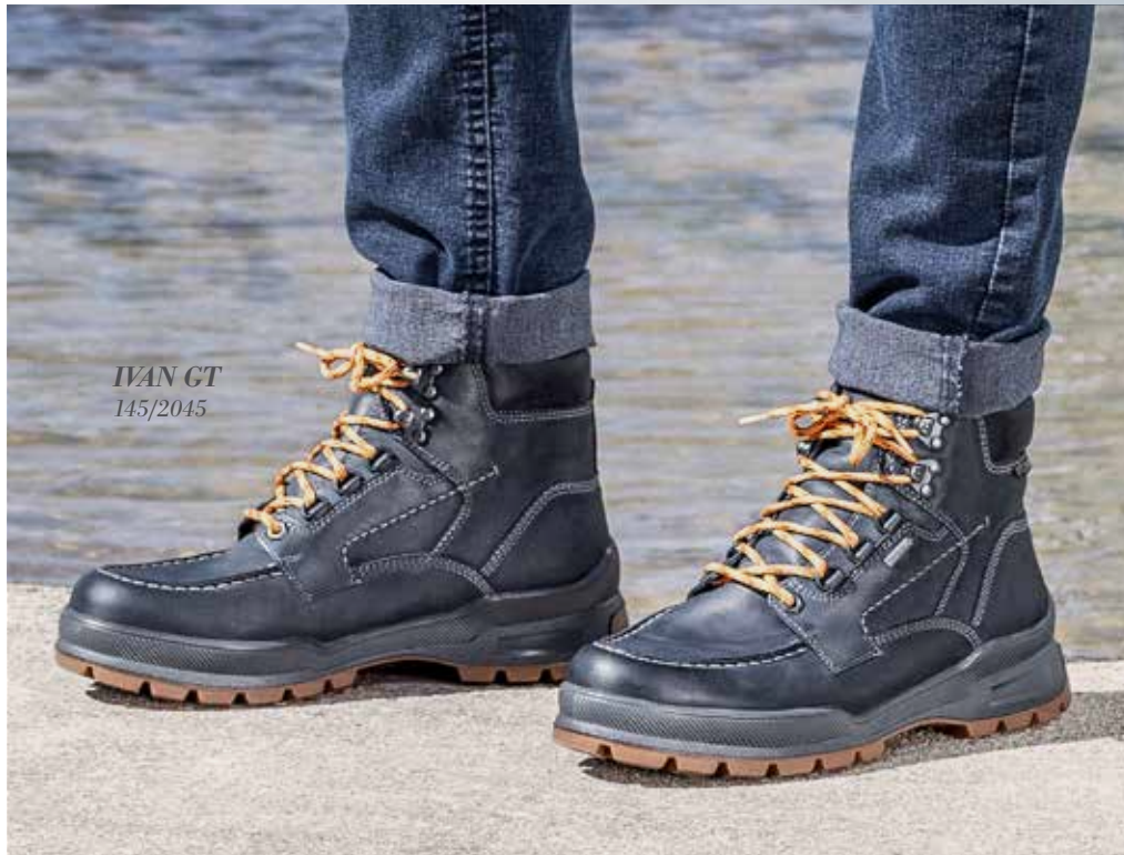
IVAN GT 145/2045