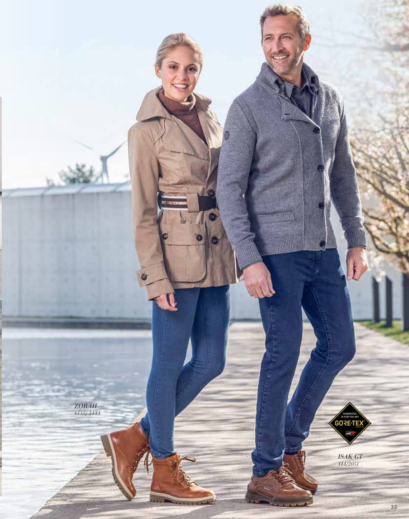
ZORAH 6135/ 5444