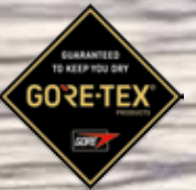
ISAK GT 144/2051