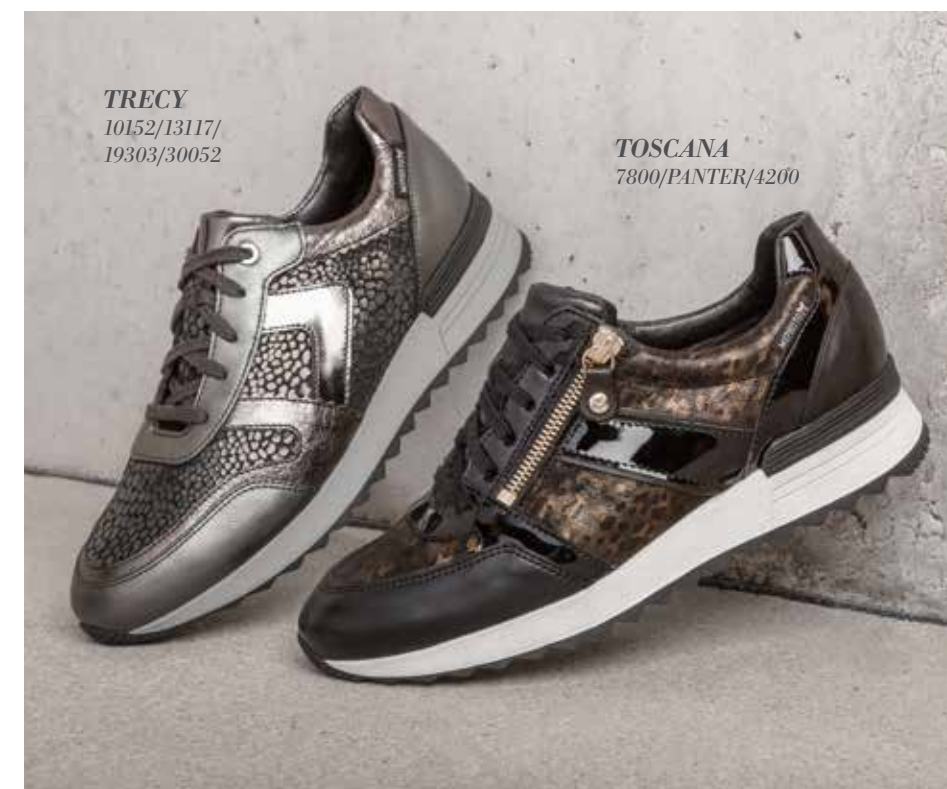
TRECY 10152/13117/ 19303/30052