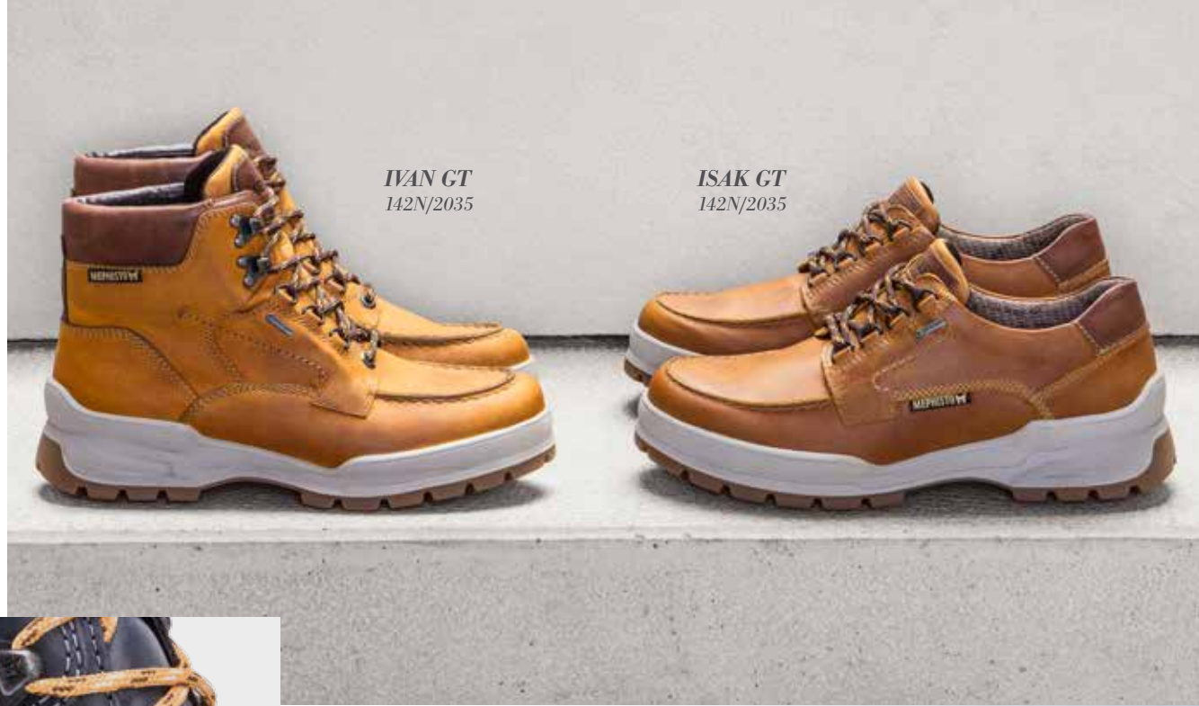
IVAN GT 142N/2035