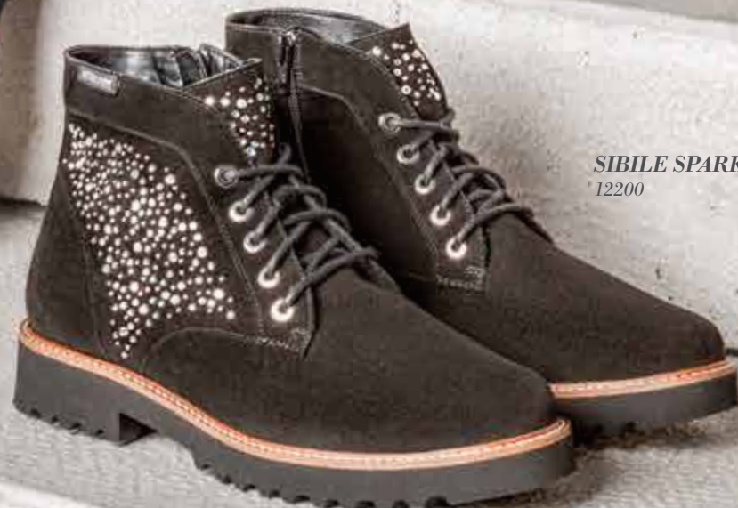
SIBILE SPARK 12200